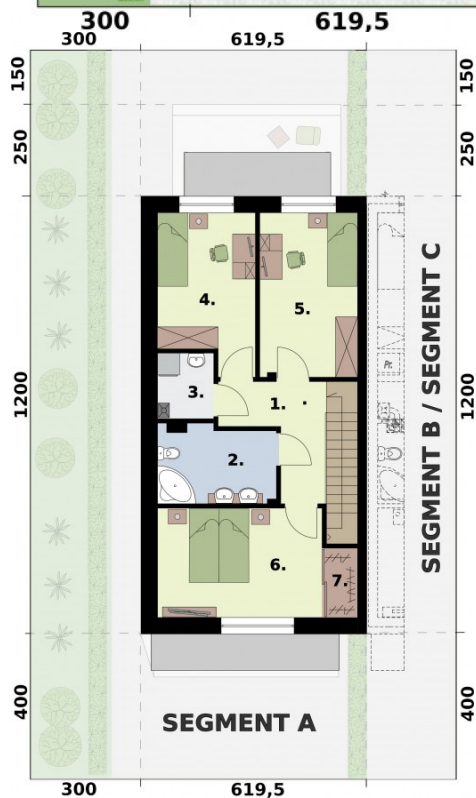
SEGMENT A - rzut piętra