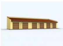
G95 garaż sześciostanowiskowy wymiar obiektu: 22.23m x 7m 134.58m 2 1290 zł