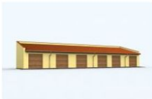
G93 garaż sześciostanowiskowy wymiary obiektu: 26.86m x 7m 157.68m 2 1290 zł