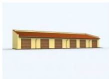
G93 garaż sześciostanowiskowy wymiar obiektu: 26.86m x 7m 157.68m 2 1290 zł