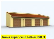
G94 garaż czterostanowiskowy wymiary obiektu: 14.66m x 7m 89.72m 2 890 zł