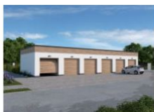
G341 garaż sześciostanowiskowy wymiary obiektu: 19.23m x 7m 115.32m 2 1290 zł

Budujesz osiedla domów mieszkalnych, a może budynki wielorodzinne lub reprezentujesz spółdzielnię, zarząd budynków miejskich, wspólnotę mieszkaniową? Szukasz dobrego pomysłu na wolnostojące garaże wielostanowiskowe? Oto gotowy zestaw dla Ciebie.