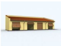
G92 garaż czterostanowiskowy 105m 2 1090 zł