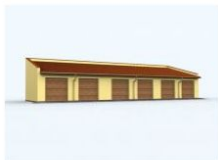
G95 garaż sześciostanowiskowy wymiary obiektu: 22.23m x 7m 134.58m 2 1290 zł