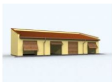
G92 garaż czterostanowiskowy 105m 2 1090 zł