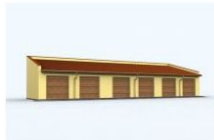
G95 garaż sześciostanowiskowy wymiar obiektu: 22.23m x 7m 134.58m 2 1290 zł