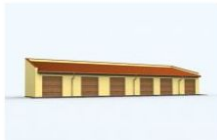
G93 garaż sześciostanowiskowy wymiar obiektu: 26.86m x 7m 157.68m 2 1290 zł