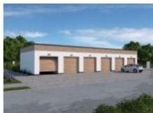
G341 garaż sześciostanowiskowy wymiar obiektu: 19.23m x 7m 115.32m 2 1290 zł

Budujesz osiedla domów mieszkalnych, a może budynki wielorodzinne lub reprezentujesz spółdzielnię, zarząd budynków miejskich, wspólnotę mieszkaniową? Szukasz dobrego pomysłu na wolnostojące garaże wielostanowiskowe? Oto gotowy zestaw dla Ciebie.