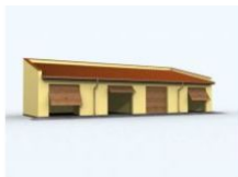
G92 garaż czterostanowiskowy 105m 2 1090 zł