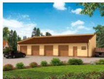
G268 garaż czterostanowiskowy... wymiar obiektu: 18.23m x 7m 112.15m 2 1090 zł