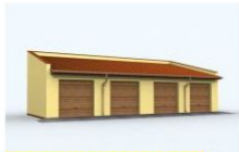
Nowa super cena 1190 zł 890 zł G94 garaż czterostanowiskowy wymiar obiektu: 14.66m x 7m 89.72m 2 890 zł